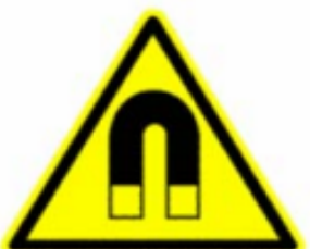
Campo magnetico intenso