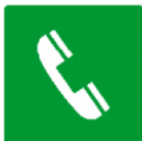
Telefono per salvataggio e pronto soccorso