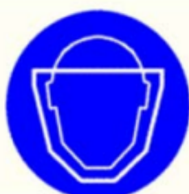
Protezione obbligatoria del viso