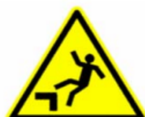
Caduta con dislivello