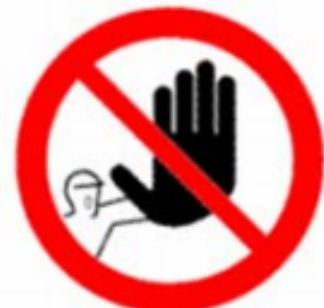
Divieto di accesso alle persone non autorizzate