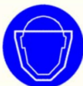
Protezione obbligatoria del viso