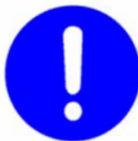
Obbligo generico (con eventuale cartello supplementare)