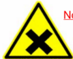
Sostanze nocive o irritanti