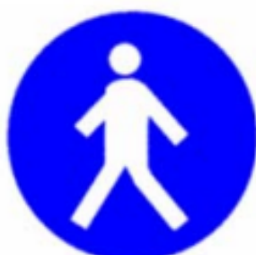
Passaggio obbligatorio per i pedoni