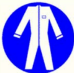
Protezione obbligatoria del corpo