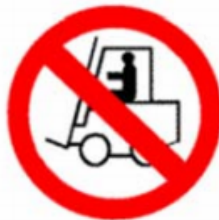
Vietato ai carrelli in movimentazione