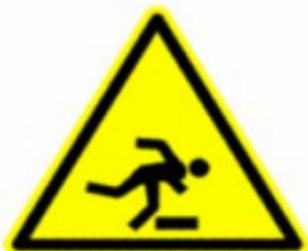
Pericolo di inciampo