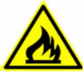
Materiale infiammabile o alta temperatura