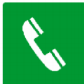
Telefono per salvataggio e pronto soccorso