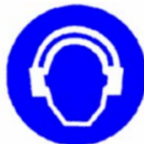
Protezione obbligatoria dell'udito