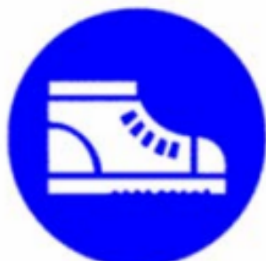
Calzature di sicurezza obbligatorie