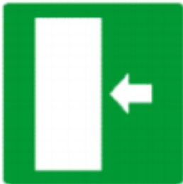
Percorso / Uscita di emergenza