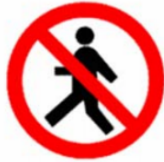
Vietato ai pedoni