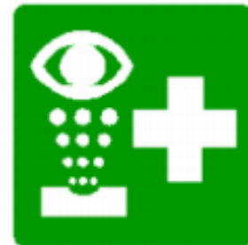
Lavaggio degli occhi