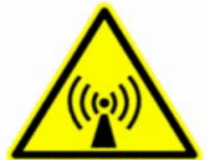
Radiazioni non ionizzanti