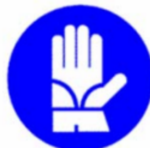
Guanti di protezione obbligatoria