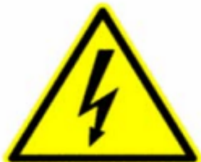
Tensione elettrica pericolosa