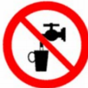
Acqua non potabile