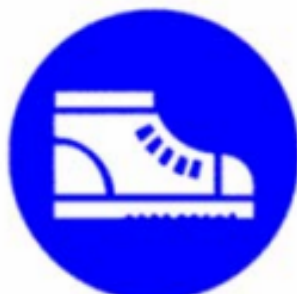
Calzature di sicurezza obbligatorie