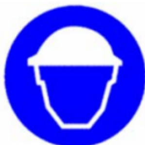
Casco di protezione obbligatorio