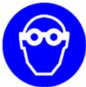
Protezione obbligatoria degli occhi