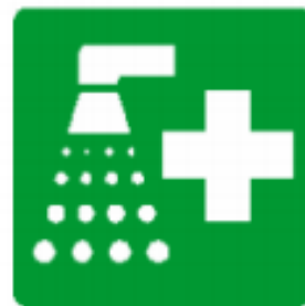
Doccia di sicurezza