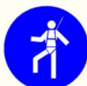
Protezione individuale obbligatoria contro le cadute