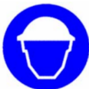
Casco di protezione obbligatorio