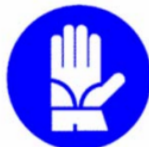
Guanti di protezione obbligatoria