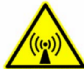
Radiazioni non ionizzanti