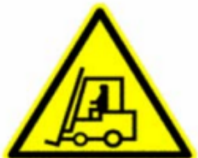
Carrelli di movimentazione