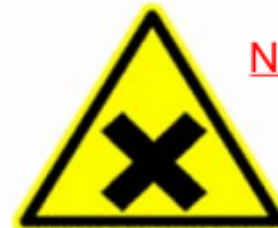
Sostanze nocive o irritanti