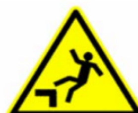
Caduta con dislivello