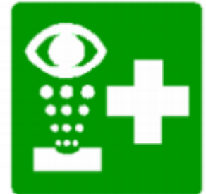
Lavaggio degli occhi