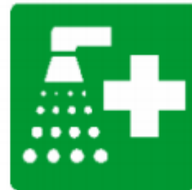
Doccia di sicurezza