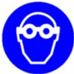
Protezione obbligatoria degli occhi