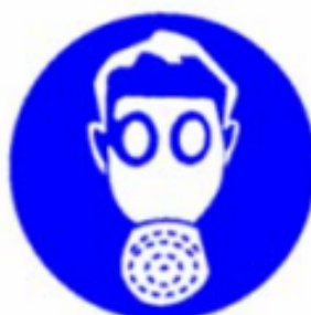
Protezione obbligatoria delle vie respiratorie