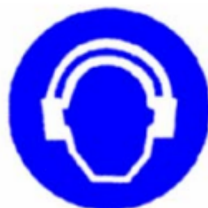
Protezione obbligatoria dell'udito