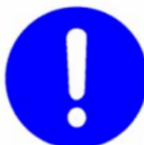
Obbligo generico (con eventuale cartello supplementare)