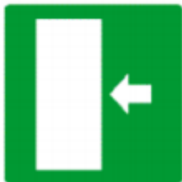
Percorso / Uscita di emergenza