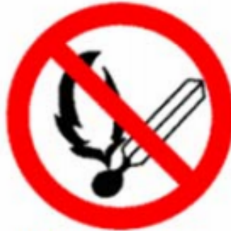
Vietato fumare o usare fiamme libere